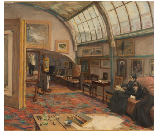
Bild: Werk von Max Liebermann für Führung in Stiftung Brandenburger Tor

Taktildrucke auf festem Material in Ausstellungen fest installiert oder als mobile Schwelldrucke auf Papier für Führungen