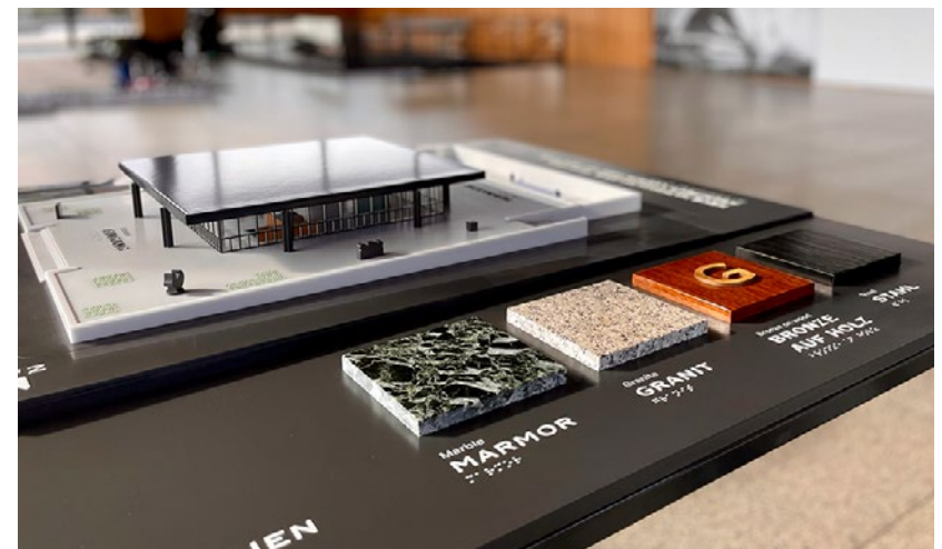
Bild: Architekturmodell für Neue Nationalgalerie Berlin