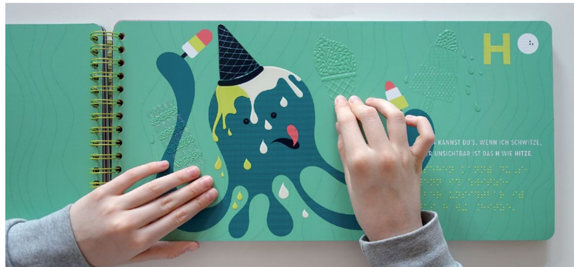
Bild: „Das Alphabet der unsichtbaren Dinge“, inklusives ABC-Buch für Anderes Sehen e.V.

Konzeption, Gestaltung und Produktion von taktil illustrierten inklusiven Büchern: Ausstellungs- und Museumsbücher