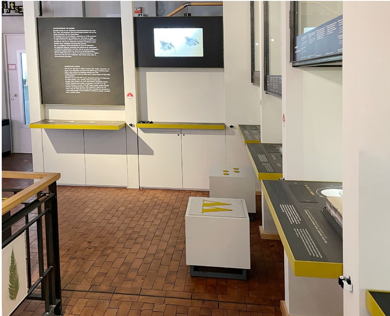
Bild: Dauerausstellung Drucktechnik "Schrift, Bilder und Zeichen", Deutsches Technikmuseum Berlin